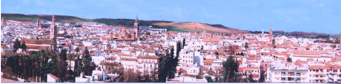
Vista general del Conjunto Histórico-Artístico de Écija

Palacio de Alcántara C/ Emilio Castelar nº45 41400 Écija - Sevilla